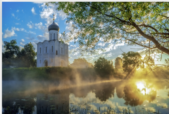
(Церковь Покрова на Нерли)

Белокаменный храм во Владимирской области России, находящийся в полутора километрах от Боголюбова, является признанным памятником зодчества Владимиро-Суздальской школы. Андрей Боголюбский особо трепетно относился к почитанию Богородицы, и почти все храмы из построенных им и ныне нам известных посвящены именно Божией Матери. А церковь на Нерли, возведенная при Андрее Боголюбском, оказалась не только первой, посвященной празднику Покрова, но и единственной на последующие 200 лет. В большом количестве Покровские храмы стали появляться только с XIV века.